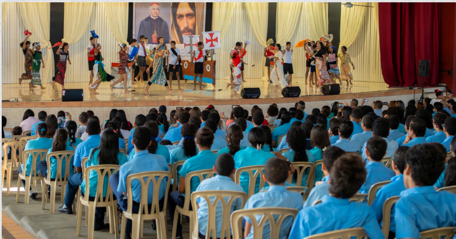
Auditorio Ciriaco Sancha