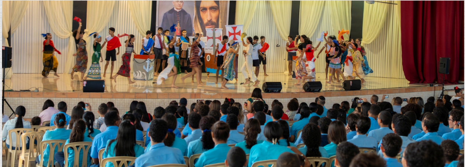
Auditorio Ciriaco Sancha